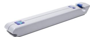
Batteriepack 24V/DC 5Ah